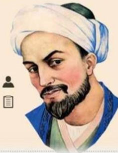
سعدی شیرازی شاعر ایرانی

هر که عیب دگران پیش تو آورد و شمرد، بے گمان عیب تو پیش دگران خواهد برد.