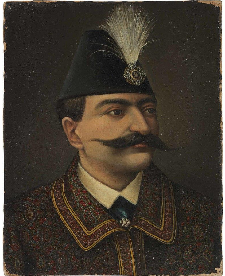
پرتره ناصرالدین شاه – نقاش کمال الملک

در زمان بازدید ناصرالدین شاه از دارالفنون از تابلو هایی که کشیده بود بسیار خوشش آمد و من را به عنوان نقاش دربار انتخاب کرد و لقب نقاش باشی را به من داد.